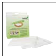
Osmo Easy Pad